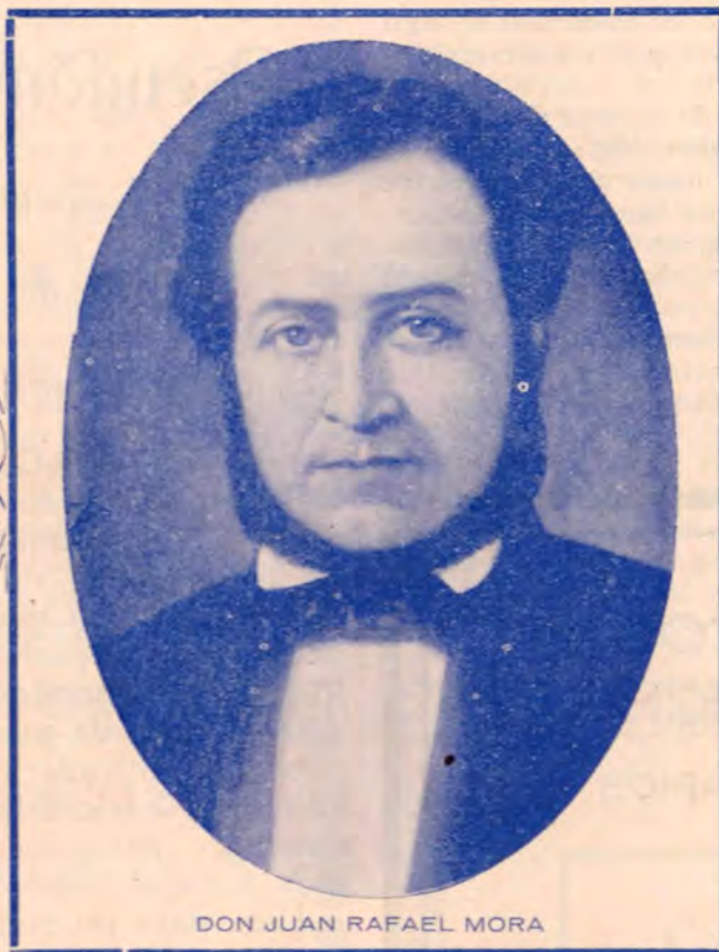
DON JUAN RAFAEL MORA

En la mañana del 11 de abril de 1856, Mora se dejó sorprender por Walker y en pocos momentos se hizo éste dueño de casi toda la ciudad, fortificándose en los mejores edificios. Pasados los primeros instantes de natural confusión, los nuestros comenzaron el ataque de las posiciones enemigas con mucha intrepidez. La más fuerte era una casa grande conocida con el nombre de Mesón de Guerra. Un soldado de Alejuela, llamado Juan Santamaría y por mote El Erizo , haciendo heroicamente el sacrificio de su vida, incendió el Mesón y los filibusteros lo abandonaron. Estrechado por todas partes, Walker tuvo que refugiarse con todos los suyos en la iglesia parroquial, de donde se escapó durante la noche, dejando parte de sus heridos, que al día siguiente fueron asesinados por algunos soldados, acción indigna de un pueblo civilizado que peleaba con heroico entusiasmo por su libertad.