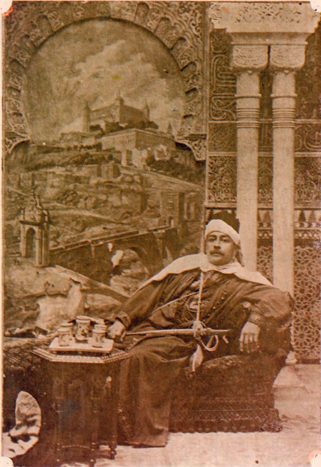
Froylán Turcios, Notable literato hondureño